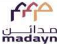
المناطق الصناعية (مدائن)